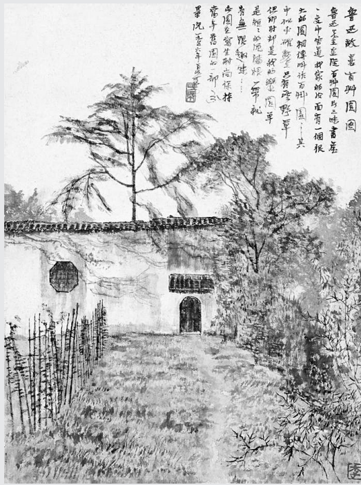
《鲁迅故居百草园图》 1956年