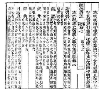
▲乾隆版《顺德府志》内页