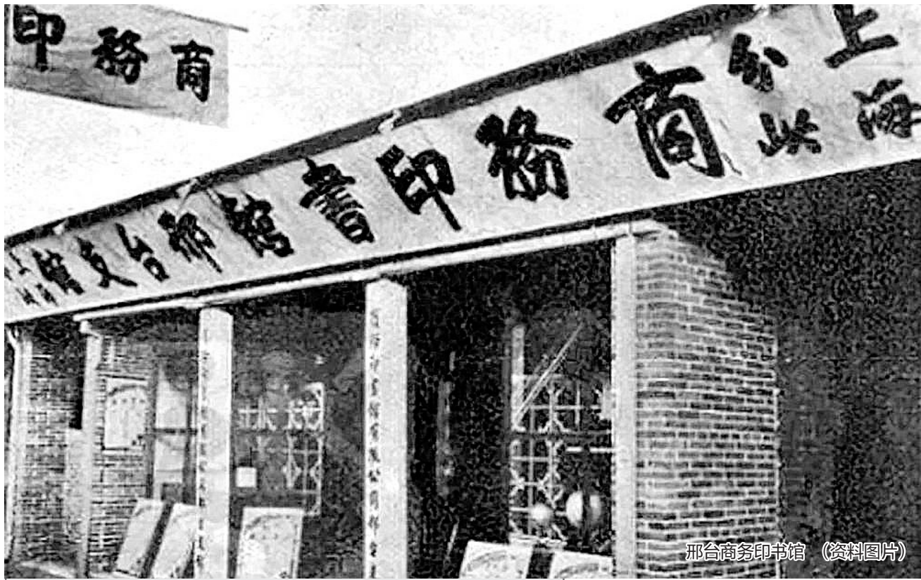
邢台商务印书馆 (资料图片)

除了众多描写邢台的诗文散章，系统性的图书遗存也是汗牛充栋。据记载，自先秦到新中国成立前，邢台各类图书及期刊遗存230余种，有记载的图书出版1000余种。如先秦时期有扁鹊的《难经》、内丘程本的《子华子》等，魏晋南北朝时期有清河张揖的《广韵》、清河张邱建的《张邱建算经》等，隋唐及五代有清河张祐的《张祐诗集》、巨鹿僧一行的《易传》、南和宋璟的《唐令》、南官张昌龄的《张昌龄文集》等，宋金元时期有清河丁度的《武经总要》、刘秉忠的《藏春集》、郭守敬的《授时历》等，明清时期有尧山樊腾凤的《五方元音》、柏乡魏晋介的《孝经注义》等，这些都成为邢台为我国文化事业奉献的瑰宝。