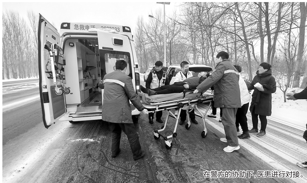
在警方的协助下,医患进行对接。

本报讯(通讯员崔信行)12月13日,一场大雪刚刚下过。邢台市内丘县公安局交通警察大队接到群众求助:一脑血栓病人陷入昏迷,急需送医抢救。接到求助后,交通警察大队快速反应,与医护人员双向联动,为抢救危重病人赢得了宝贵时间。