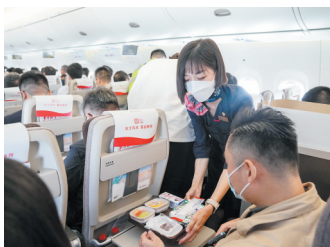
5月28日,乘务员在C919首个商业航班东航MU9191飞行途中为旅客提供餐食。