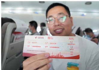
5月28日,旅客在飞机上展示C919首个商业航班东航MU9191的“纪念登机牌”。

针对C919首次商业载客飞行,东航准备了具有纪念意义的特殊登机牌。登机牌主题色为红色,还有“C919首航仪式”字样。