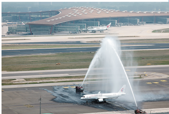
5月28日,北京首都国际机场以水门礼迎接C919首个商业航班东航MU9191。

新华社北京5月28日电(记者贾远琨、周圆)28日12时31分,经历1小时59分钟飞行,由C919大型客机执飞的东方航空MU9191航班平稳降落在北京首都国际机场,穿过象征民航最高礼仪的“水门”,标志着该机型圆满完成首个商业航班飞行,正式进入民航市场,开启市场化运营、产业化发展新征程。