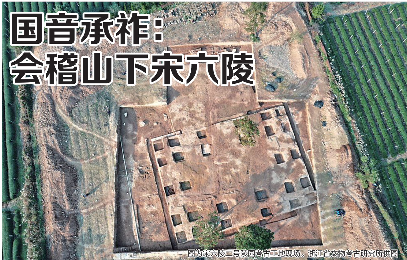
图为宋六陵二号陵园考古工地现场。