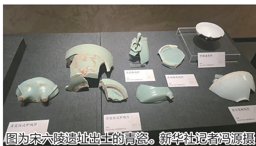
图为宋六陵遗址出土的青瓷。新华社记者冯源摄