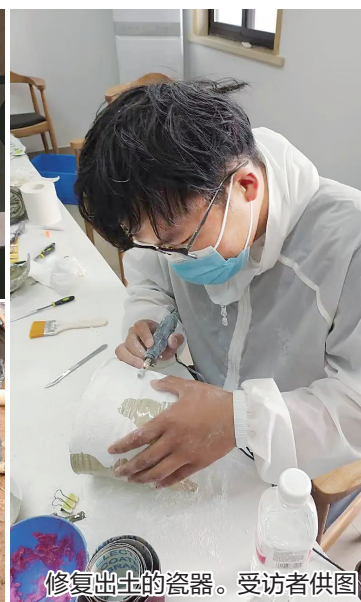
修复出土的瓷器。