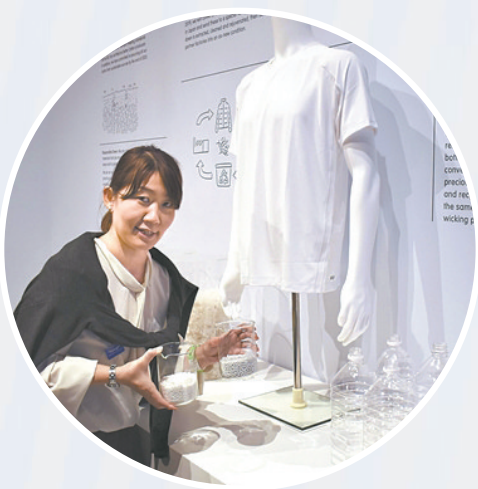
工作人员展示用回收塑料瓶制成的T恤。