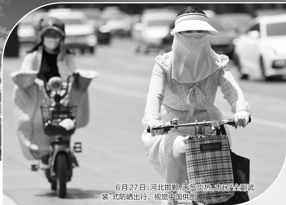
6月27日，河北邯郸，天气炎热，市民“全副武装”式防晒出行。

7月5日，河北再度迎来大范围晴热高温天气，在阳光炙烤下，多地气温一路“狂飙”，截至15时，南部地区最高气温普遍达41℃，同时包揽了14时全国气温TOP10，成为全国高温中心，其中栾城42.1℃刷新河北今年最高气温纪录。预计今明两天，河北大部仍维持晴热暴晒的天气格局，中南部局地可达40℃以上，市民需做好防暑降温工作，谨防中暑和热射病。