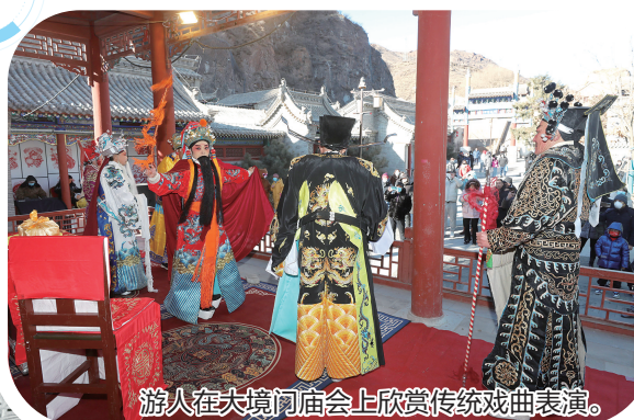
游人在大境门庙会上欣赏传统戏曲表演。