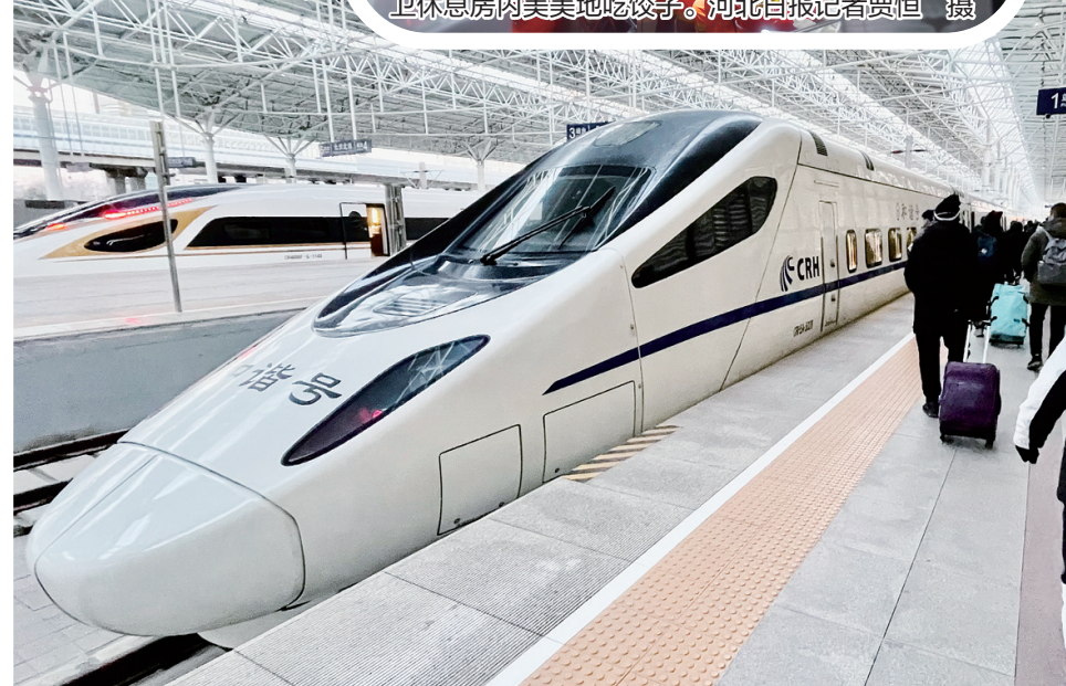
春节假期，北京市民乘坐京张高铁“滑雪专列”去崇礼滑雪。