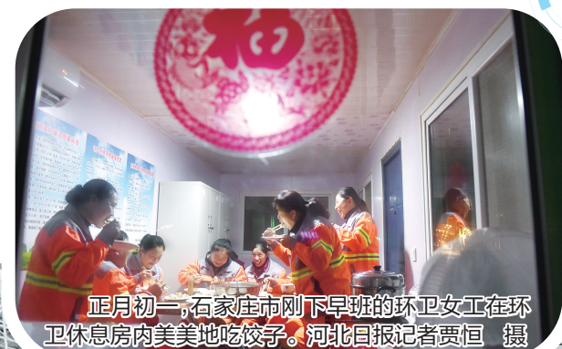
正月初一，石家庄市刚下早班的环卫女工在环卫休息房内美美地吃饺子。