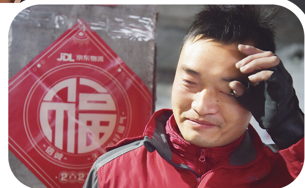
除夕，坚守岗位、不辞辛苦的快递小哥。