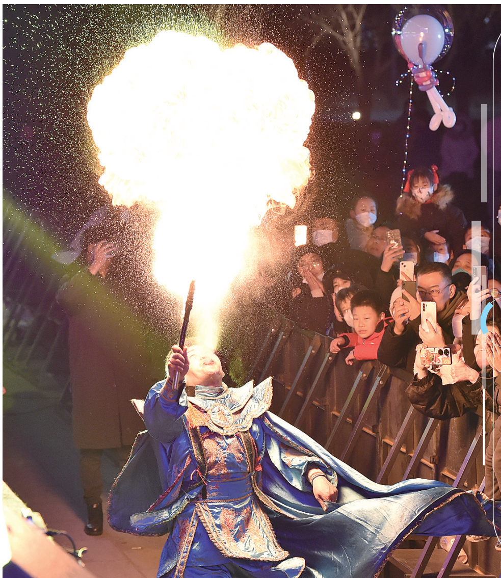
游客在正定园博园观看川剧变脸喷火表演。