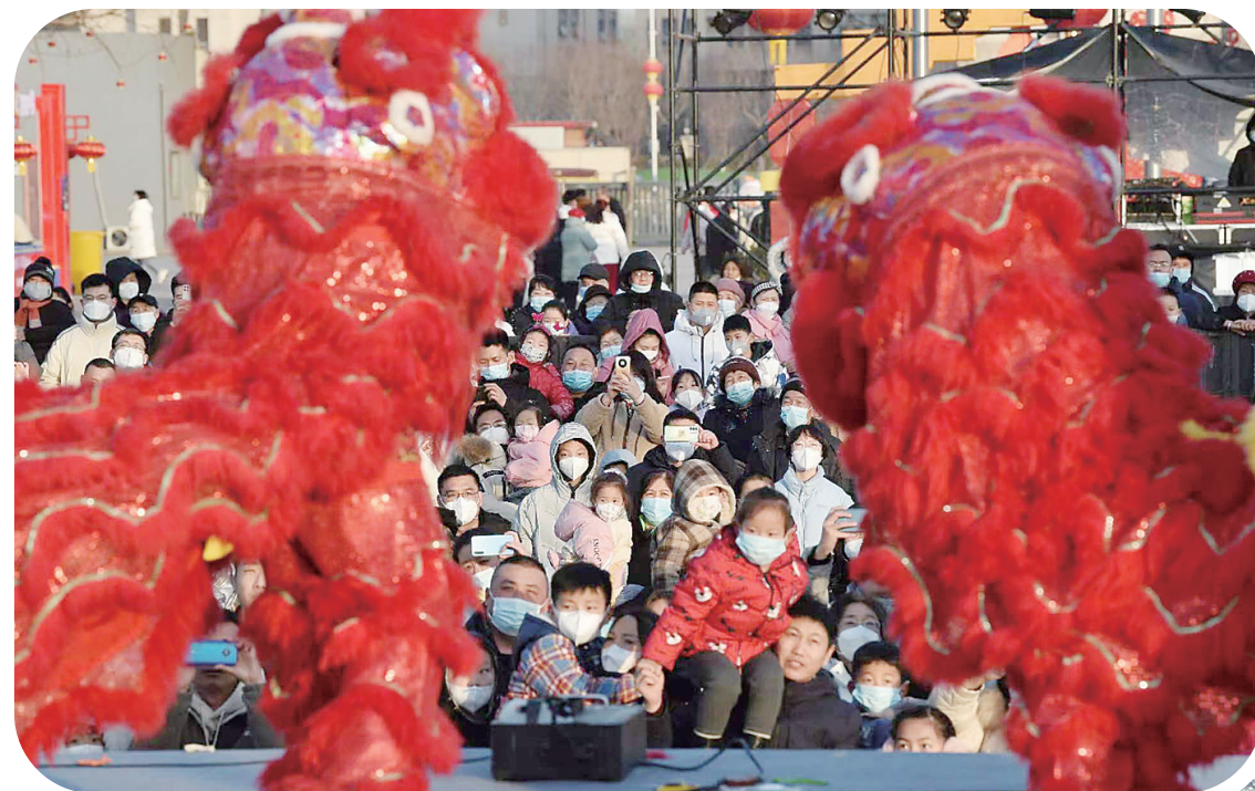
游客在正定园博园观看舞狮表演。