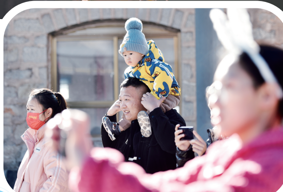
井陘县南康庄村，游客观看传统“红脸社火”表演。