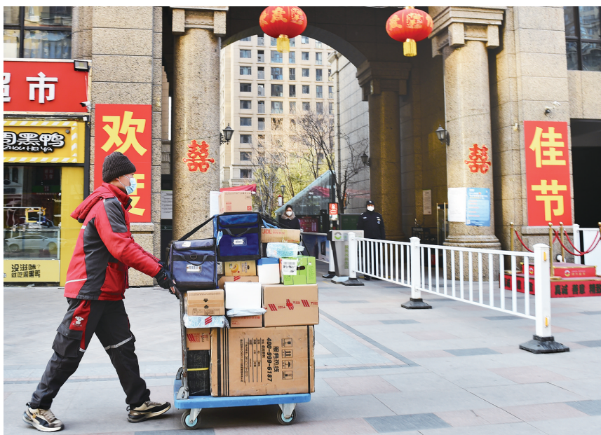
石家庄街头，春节不歇班的快递小哥。