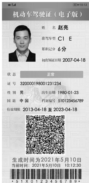
这是机动车驾驶证(电子版)样证。