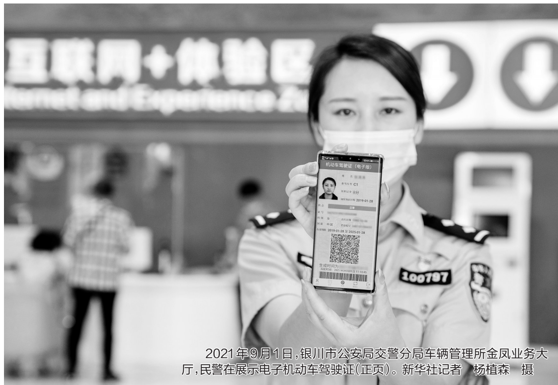
2021年9月1日,银川市公安局交警分局车辆管理所金凤业务大厅,民警在展示电子机动车驾驶证(正页)。

按照公安部统一部署,电子驾驶证在全国全面推行!你们都申领电子驾驶证了吗?不少小伙伴都有这样一个疑问:申请了电子驾驶证以后纸质驾驶证还有用吗?有用!电子驾驶证很有用但也不是万能的。