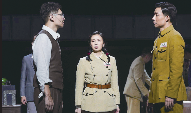
《直播开国大典》剧照