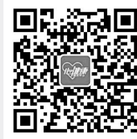
心健康服务平台公众号