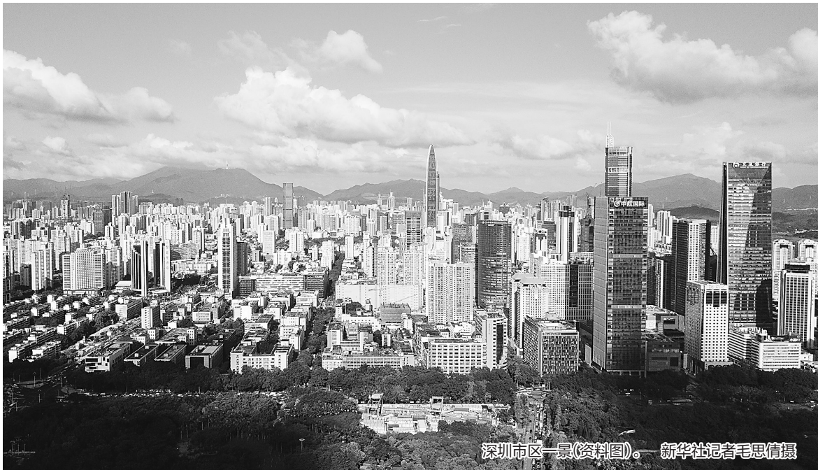
深圳市区一景(资料图)。

白皮书指出,全面小康,经济发展是基础。全面小康,既有效保障人民经济权利,也有效保障人民政治权利。全面小康,是物质文明和精神文明协调发展的小康,既是国家经济实力增强,也是国家文化软实力提升;既是人民仓廪实、衣食足,也是人民知礼节、明荣辱。全面小康,以人为本,民生为先。良好生态环境是最普惠的民生福祉,是全面小康最亮丽的底色。