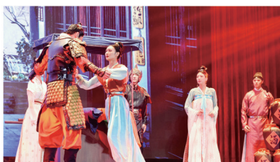
四方安定,久别重逢