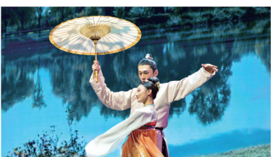
采薇上林,雨中相遇