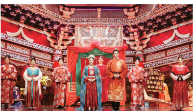
盛唐大婚,国风国礼