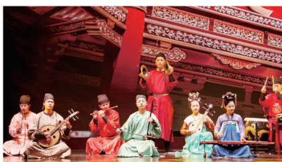
西安外事古乐团,奏响国风音乐盛宴