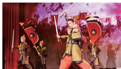
离别惊梦,家国情深