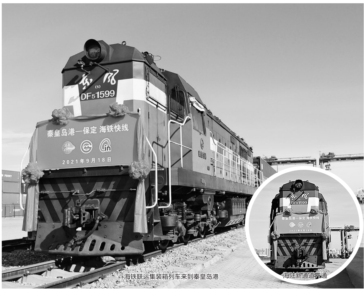
海铁联运集装箱列车来到秦皇岛

据悉,“保定—秦皇岛港—仁川”海陆新通道全程采用“集装箱铁路+集装箱班轮”运输模式,较以往公路运输模式能耗更低,排放更少,助力京津冀打赢蓝天保卫战。该通道实现了内陆港与沿海港口无缝对接,可同时执行内贸、外贸、“一带一路”及中欧班列、中国东盟班列运输业务,国内辐射华东、华南,国际辐射欧美、日韩和中亚,将有效促进区域间货物循环和经贸往来,助力构建“双循环”新发展格局。