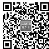
76项事项清单见本报微信

申请材料齐全且符合法定形式的,综合受理窗口作出受理决定,电子档案即时推送至相关审批处室,需要提交相应纸质档案的,综合受理窗口即时通知申请人并告知邮寄地址。申办材料不齐全或不符合法定形式的,综合受理窗口出具《补齐补正告知书》,通知申请人需修改完善的内容。申请人关于在线申报的相关问题可拨打咨询电话:2806271、2806228、2806237。