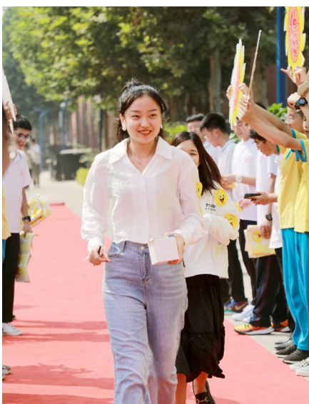
老师在学生的祝福下走过红毯