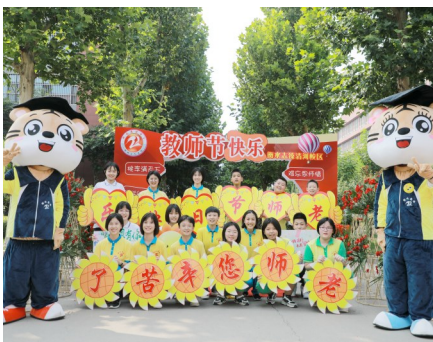
学生举异形牌祝福老师节日快乐

教师是人类社会最古老的职业之一；是人类文化科学知识的继承者和传播者，是人类灵魂的工程师。9月10日，清河志臻学校全校师生喜迎第37个教师节，开展了仪式感十足的教师节活动。