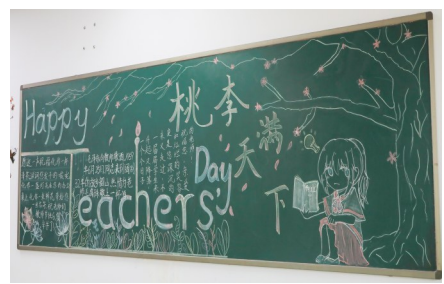
学生花式祝福教师一

老师的工作在今朝，却建设着祖国的明天；老师的教学在课堂，却却是在祖国的四面八方。三尺讲台渡芳华，一支粉笔写人生；孜孜不倦育新人，勤勤恳恳浇花朵。在第37个教师节之际，清河志臻学校为平日辛勤耕耘的老师送上了一个爱意满满的教师节。