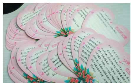
学生花式祝福教师三