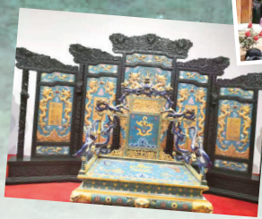
乾隆皇帝的屏风和宝座