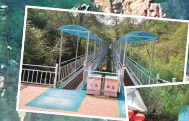
麒麟山的狮身人面像