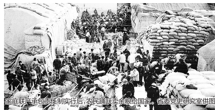
家庭联产承包责任制实行后,农民踊跃卖余粮给国家。

“1988年,父亲开始担任村支部书记,他又开始思考新问题:一亩地一吨粮已经到顶了,吃穿、化肥、种子、农药的费用却是一天比一天高,粮食丰收了,还是富不起来,怎么办?”