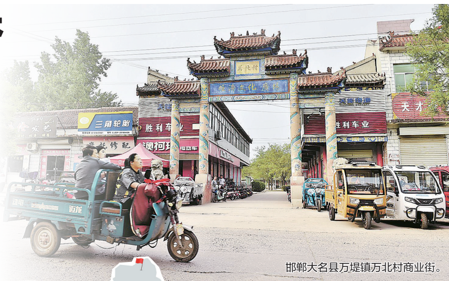
邯郸大名县万堤镇万北村商业街。