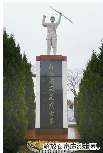
解放石家庄烈士墓。

华北军区烈士陵园安葬着马本斋、周建屏、常德善、包森、周文彬等牺牲在华北地区的318位团职以上的革命烈士，安放着650多位烈士和老红军的骨灰，国际主义战士诺尔曼·白求恩和柯棣华大夫均安葬于此。