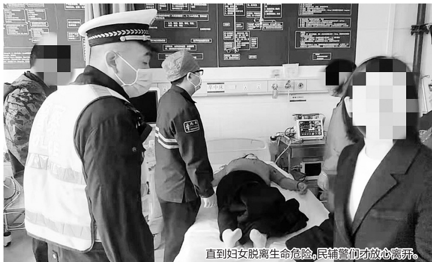
直到妇女脱离生命危险，民辅警们才放心离开。

本报讯(燕都融媒体记者任利 通讯员许静、李忠勇)4月5日中午时分,井陘县交警大队接到当地群众求助,一名妇女因服用农药中毒,情况十分危急,需要紧急送医救治。井陘县交警大队天长中队立即安排警车对接上运