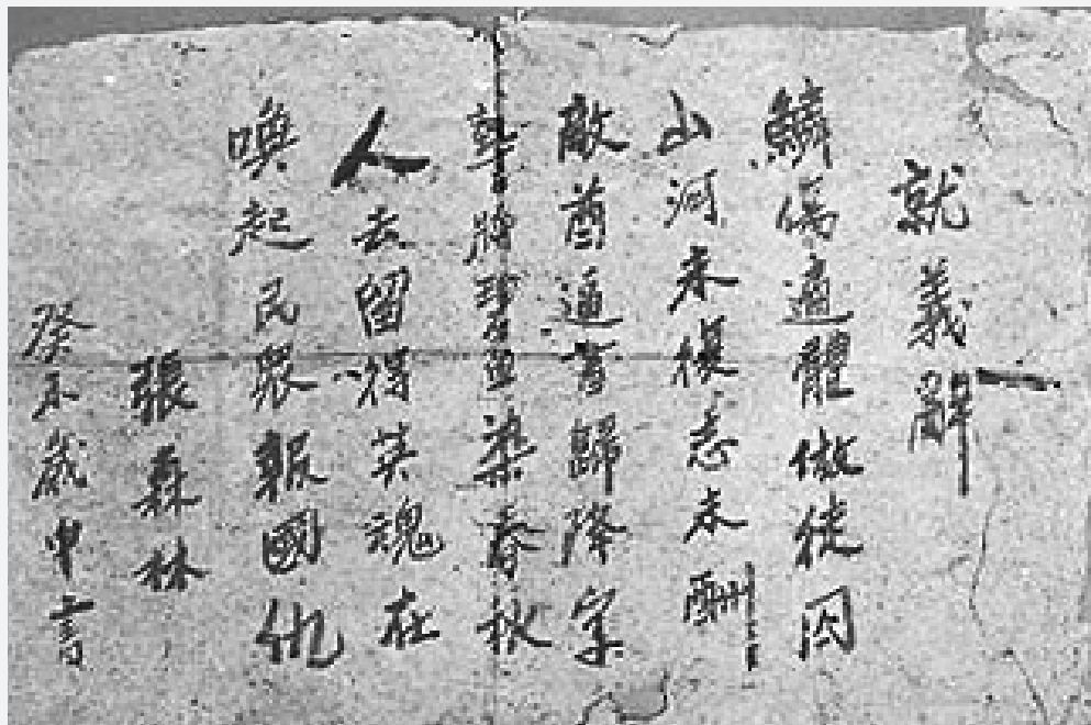
张森林遗诗《就义辞》