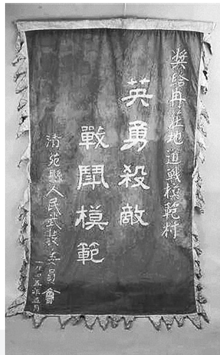
清苑县武委会奖给冉庄地道战模范村的奖旗