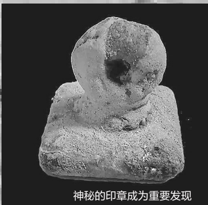
神秘的印章成为重要发现