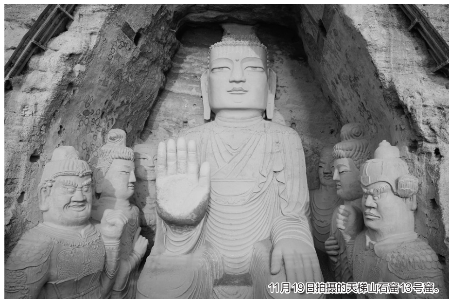
11月19日拍摄的天梯山石窟13号窟。

特区政府将加强病毒检测计划,有症状人士、养老院职工、出租车司机这3个群组将尽快进行强制检测,政府正筹备落实有关工作。另外,由于不同地区都出现确诊患者,特区政府将在疫情严重的大厦或地区设置流动采样亭、增添样本瓶等,尽快为市民进行检测。