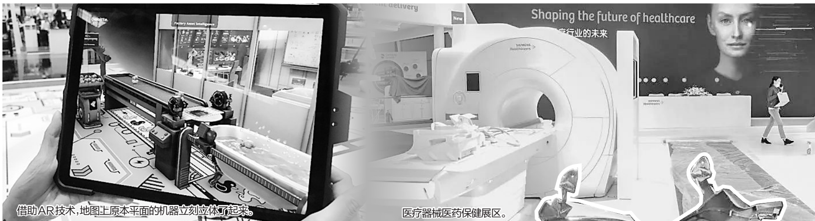
借助AR技术,地图上原本平面的机器立刻立体了起来。