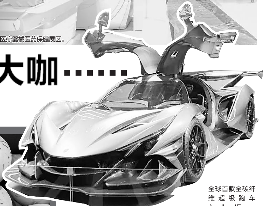
全球首款全碳纤维超级跑车 Apollo IE。

精度达到微米级。首次参展进博会的打印巨头日本爱普生,拿出了“杀手锏”产品——PaperLab千纤维纸张循环系统。与传统造纸最大的区别是,其纸张再生过程无需消耗水资源。根据实验显示,持续使用一台PaperLab一年时间,可以省水7530吨。据透露,目前这一产品还在日本相关部门试用,这次是首次在海外展出。(上观新闻)