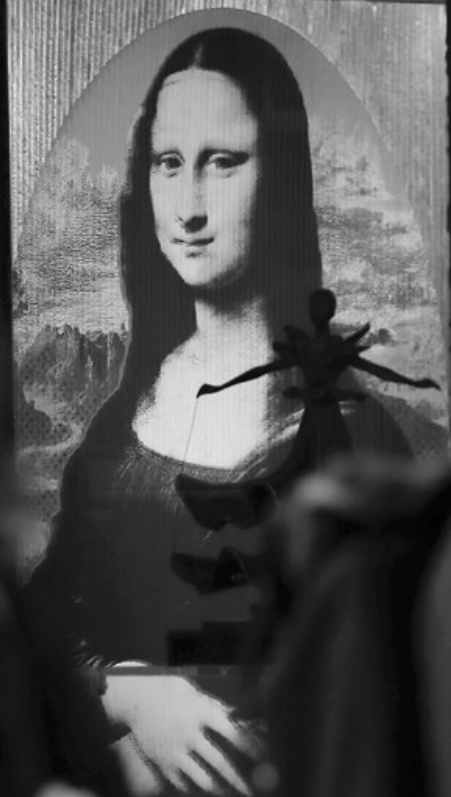
10月28日,人们走过法国巴黎蒙马特高地的一家画廊。

法国政府网站28日公布的数据显示,该国过去24小时新增新冠确诊病例36437例,累计确诊1235132例,累计死亡35785例。