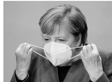
10月28日,德国总理默克尔在柏林参加关于新冠疫情的新闻发布会时摘下口罩。