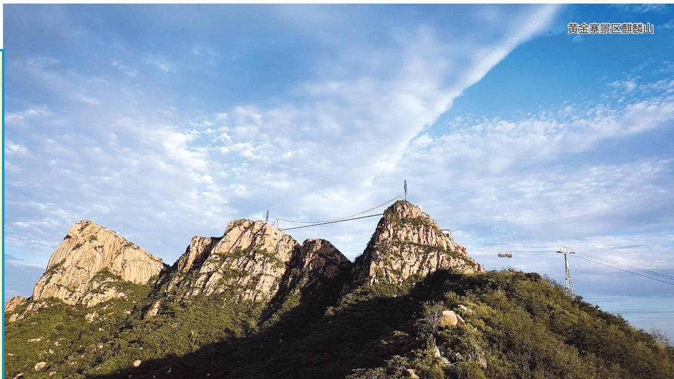
黄金寨景区麒麟山

景区地址： 黄金寨原生态旅游区 (敬业集团西邻) 联系电话： 0311-82899888 13933082528 客房电话：0311-82889999 餐厅电话：0311-82918888