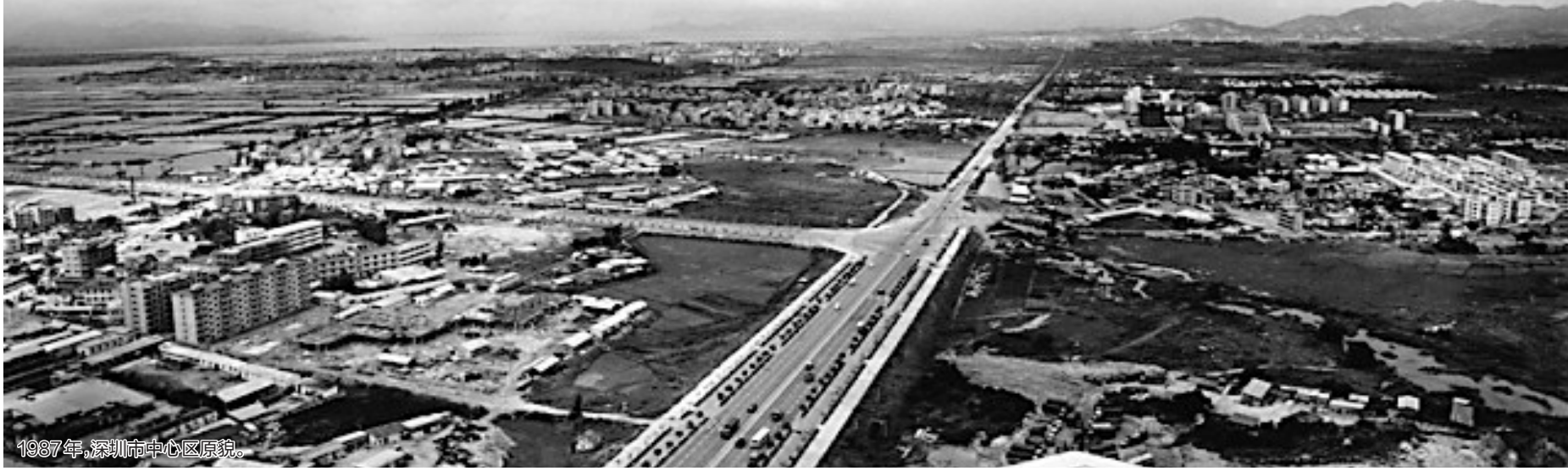
1987年，深圳市中心区原貌。