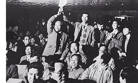
1987年12月7日，深圳国土局第一次以拍卖的方式拍卖土地使用权。