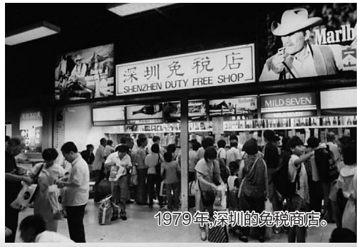
1979年，深圳的免税商店。