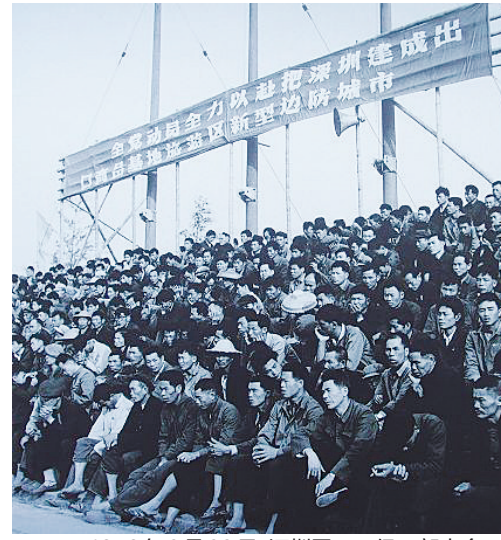
1979年2月23日，深圳召开四级干部大会。