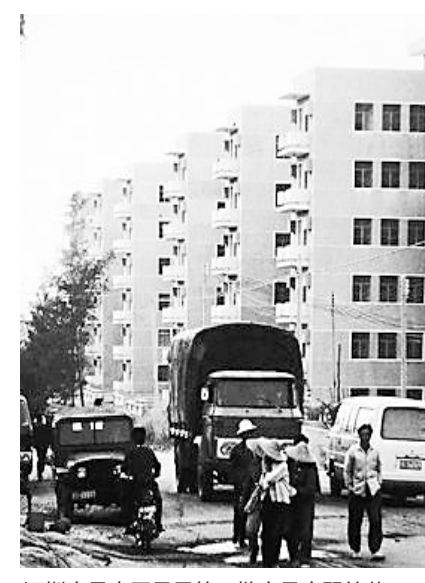
深圳也是中国最早的一批商品房翠竹苑。

中国第一个经济特区，近日再次成为世界焦点：10月14日，深圳经济特区建立40周年庆祝大会在深圳举行。而就在日前，中共中央办公厅、国务院办公厅印发《深圳建设中国特色社会主义先行示范区综合改革试点实施方案(2020—2025年)》，意在推动改革开放先行地深圳经济特区迈向更高质量发展，成为“社会主义现代化强国的城市范例”。