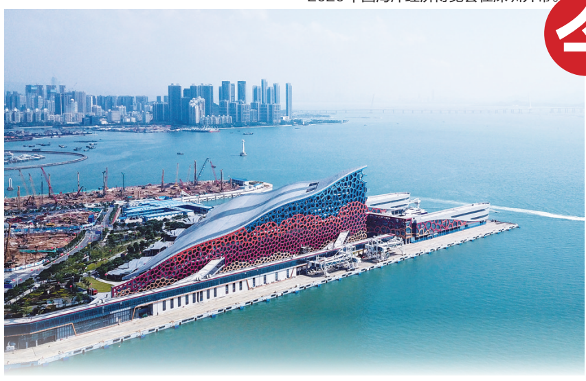
深圳市南山区蛇口太子湾邮轮母港。