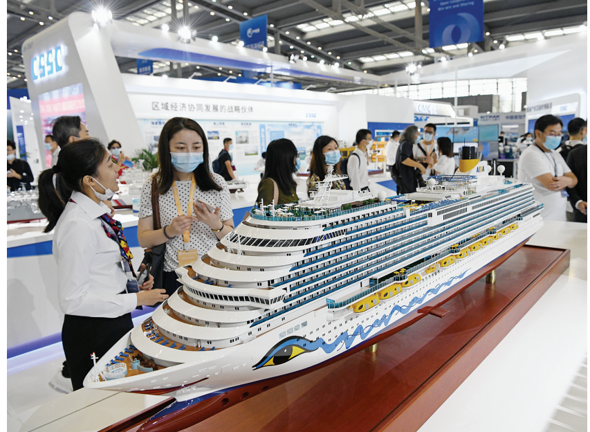
2020中国海洋经济博览会在深圳开幕。