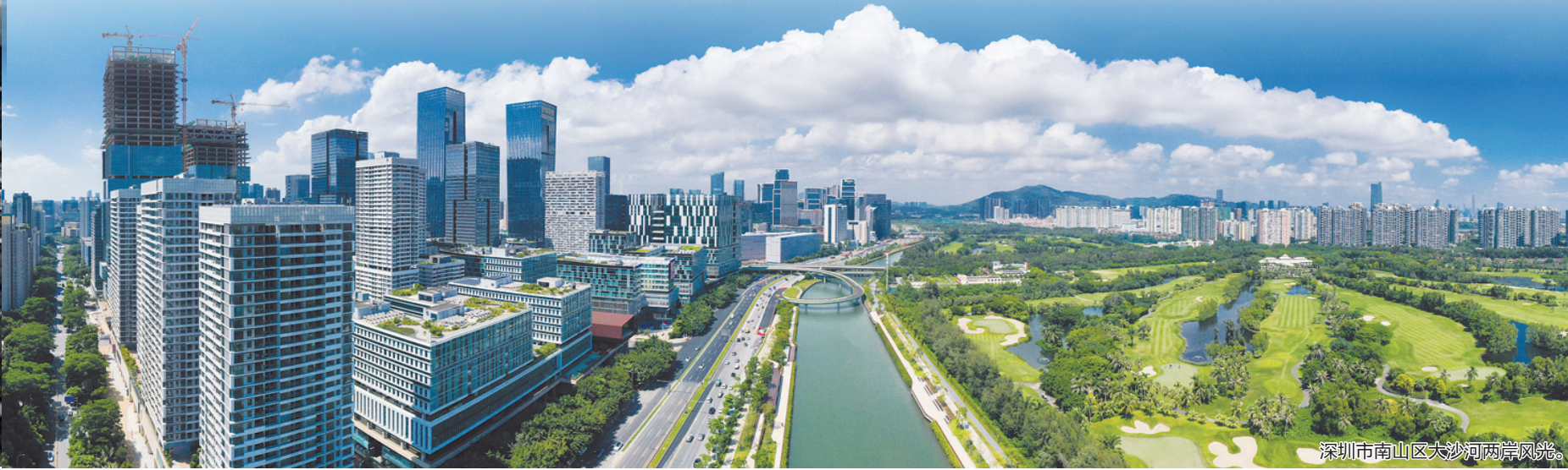
深圳市南山区大沙河两岸风光。