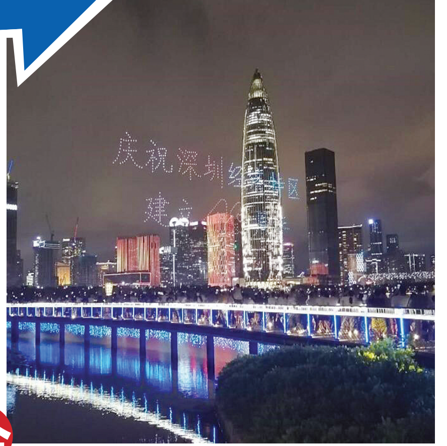
深圳人才公园，庆祝深圳特区建立40周年的无人机灯光秀。