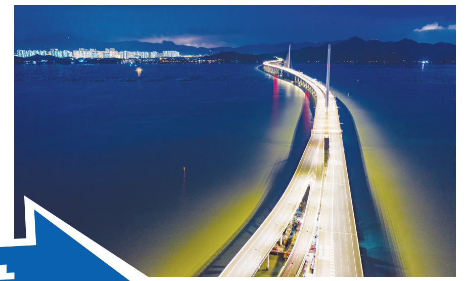
夜色中的深圳湾大桥。