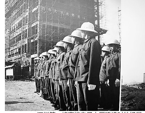
深圳第一幢高楼电子大厦建设时的场景。