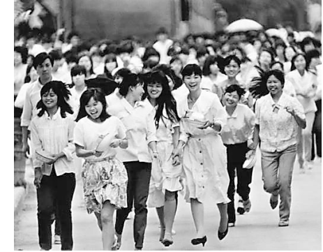
1989年，深圳蛇口凯达玩具厂下班的女工。

历史的年轮，总会在标志性节点上镌刻永恒。从40年前诞生时起，深圳敢闯敢试、敢为人先、埋头苦干，勇于突破思想观念的桎梏、利益固化的藩篱，杀出一条血路、闯出一条新路，有力印证了中国特色社会主义制度的强大生命力和巨大优越性。