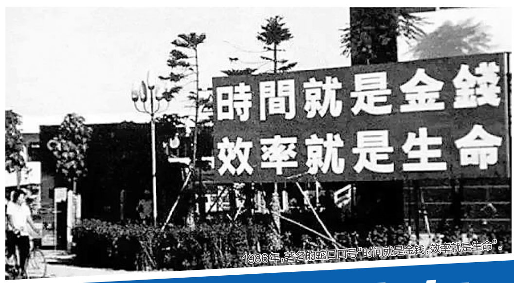
1986年，著名的蛇口口号“时间就是金钱，效率就是生命”。

中国第一个经济特区，近日再次成为世界焦点：10月14日，深圳经济特区建立40周年庆祝大会在深圳举行。而就在日前，中共中央办公厅、国务院办公厅印发《深圳建设中国特色社会主义先行示范区综合改革试点实施方案(2020—2025年)》，意在推动改革开放先行地深圳经济特区迈向更高质量发展，成为“社会主义现代化强国的城市范例”。