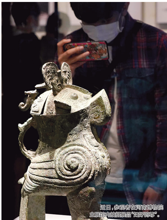
近日,参观者在河南博物院主展馆内拍摄展品“妇好鸮尊”。

根据器皿内刻的铭文加上一片甲骨的记载,主人“妇好”是中国历史上第一位有据可查的女性军事统帅、政治家。她不仅能率领军队东征西讨,拓展疆土,还亲自主持武丁王朝的各种大型祭祀活动。甲骨文记录的正是商王武丁在这些甲骨占卜中向上天祷告的内容,包括了王后妇好生活的各个侧面:征战、祭祀、生育、疾病,甚至包括对她去世后的思念和牵挂。