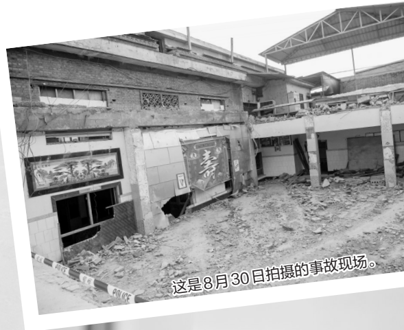
这是8月30日拍摄的事故现场。