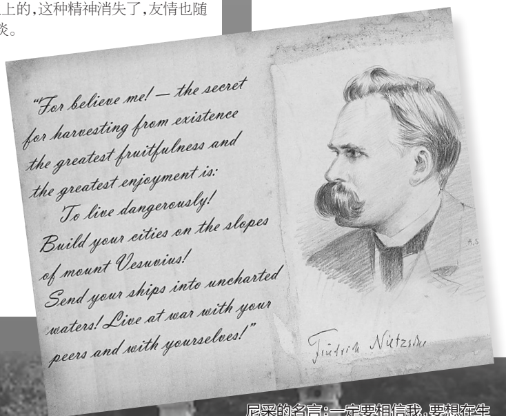
尼采的名言：一定要相信我，要想在生活中硕果累累或充满高兴，那就是要去生活在危险中。

在孤独中，尼采的心灵旋即被两种艺术所充实：埃斯库罗斯（Aeschylus）和索福克勒斯（Sophocles）的悲剧，以及华格纳的音乐。他背诵埃斯库罗斯的诗章，聆听华格纳的歌曲，把自己忘形于一个不同的而且更光辉的世界里。