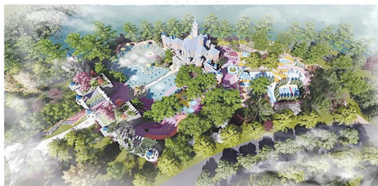
辛集城市展园效果图