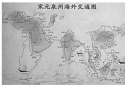
宋元泉州海外交通图