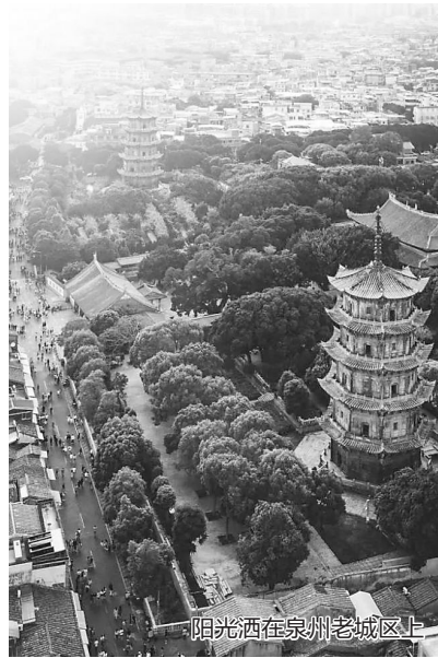
阳光洒在泉州老城区上