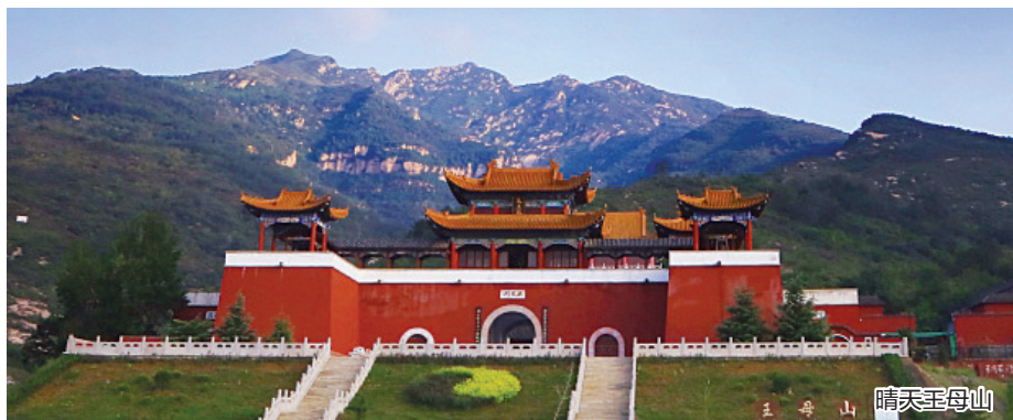
王母山 晴天王母山

景区的植被覆盖率达95%,山势绵延数十里,奇峰怪石林立,遍布洞、泉、溪、瀑,其洞深、幽、密,泉水清凉甘甜,是休闲度假、祈福养生的理想佳地。