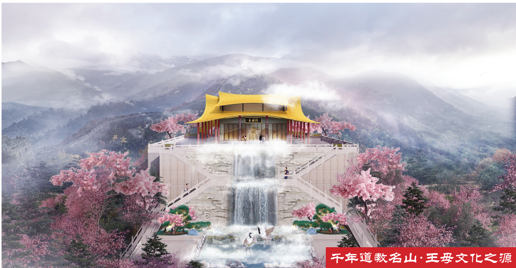
千年道教名山·王母文化之源