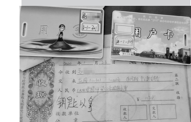
水卡电卡收据上写的是301。