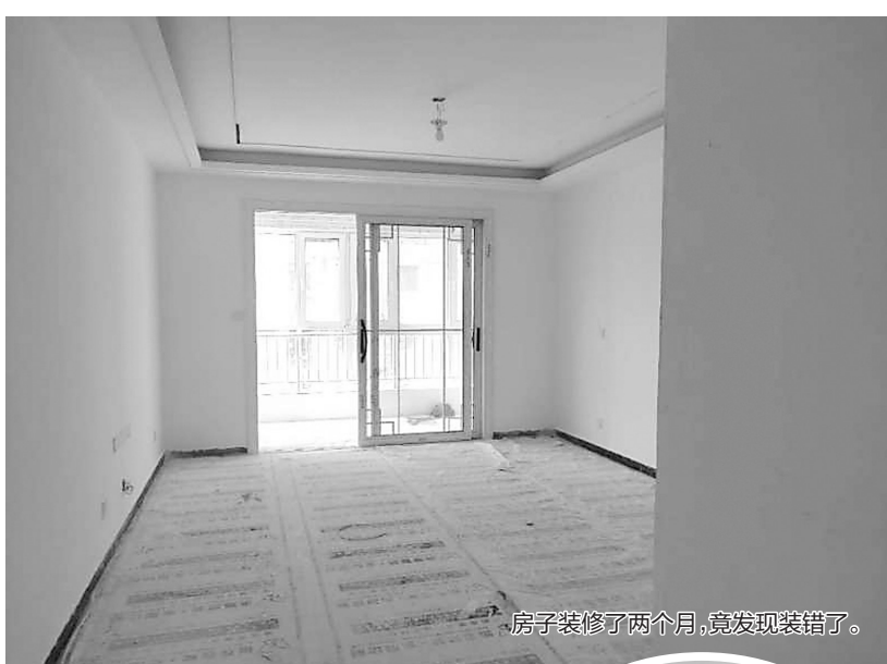
房子装修了两个月,竟发现装错了。