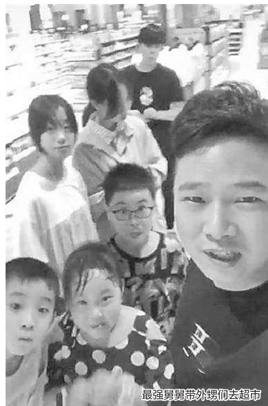
最强舅舅带外甥们去超市