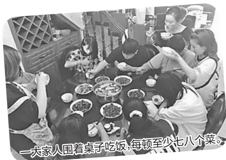
一家人围着桌子吃饭,每顿至少七八个菜。