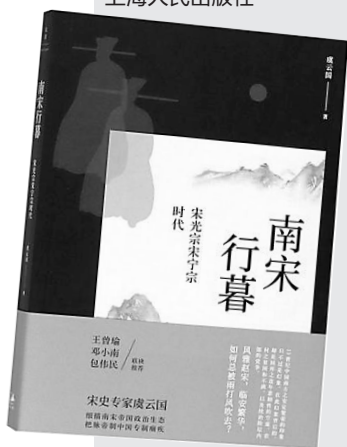
虞云国著 《细说宋朝》《南宋行暮》