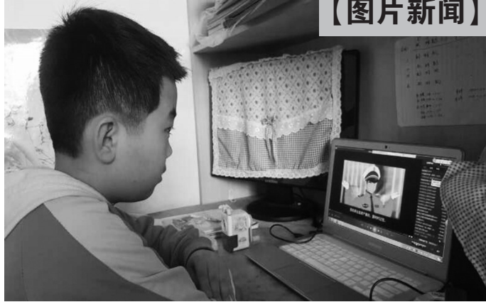
邢台交警桥西区一大队与辖区学校方沟通,利用疫情期间学生网课时段,播放交通安全教育动画视频。收到学生及家长们的学习交通安全知识反馈照片。(魏义勇)