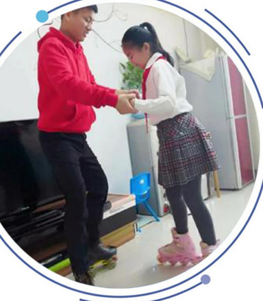
▲疫情期间教师们开展捐款、献血、线上教学等活动