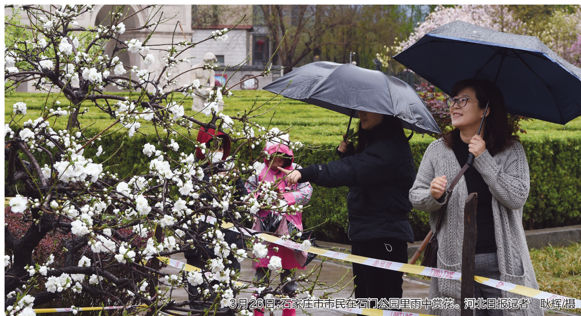
3月26日,石家庄市市民在石门公园里雨中赏花。

本报讯 据省气象台监测,从3月25日夜开始,我省大部分地区出现降水天气。截至26日16时,降水区平均降水量为3.6毫米,张家口中北部、石家庄中北部有12个县(市)超过10毫米,其中行唐降水量全省最大,为18毫米。全省有66个县(市)出现大风,邢台、邯郸、沧州局地瞬时风力达9级。