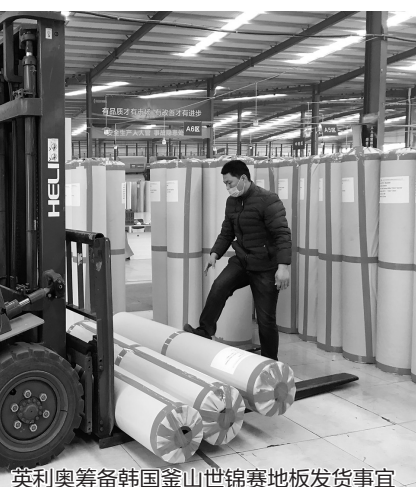
英利奥筹备韩国釜山世锦赛地板发货事宜