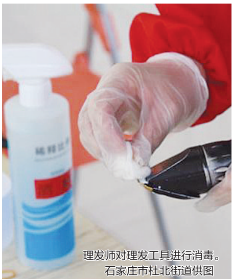
理发师对理发工具进行消毒。

记者也按照几家理发店大门上预留的电话拨打过去,接电话的人员均称店里购买了消毒液、测温枪等,为开业做准备。