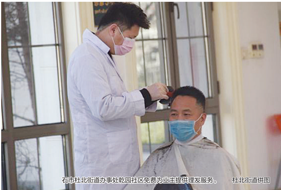
石市杜北街道办事处乾园社区免费为业主提供理发服务。

2月24日是农历二月初二,民间有“剃龙头”的说法。每年这个时候,理发店都会迎来一波客流高峰。自从新冠肺炎疫情进行防控后,石家庄市的理发店全部关闭。这两天,记者走访石家庄多条街道发现,如今理发店依然是大门紧锁还未开业,受访的理发店也均表示理发师和助理有不少已到岗,但还都是在做准备,尚未开业。