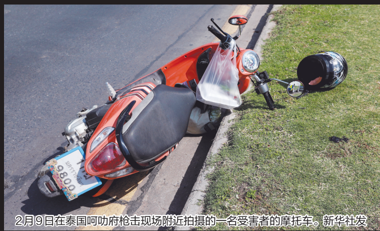
2月9日在泰国呵叻府枪击现场附近拍摄的一名受害者的摩托车。