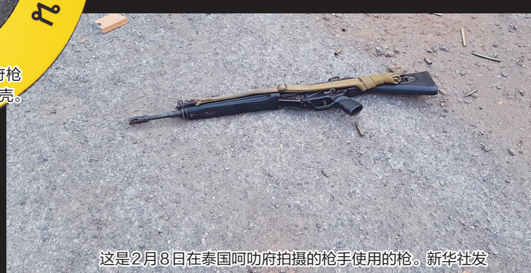
这是2月8日在泰国呵叻府拍摄的枪手使用的枪。

“我们正在尽全力。我们所有的高级官员都在这里。我们已经谨慎采取一切措施,尽我们所能把伤害降到最小。”