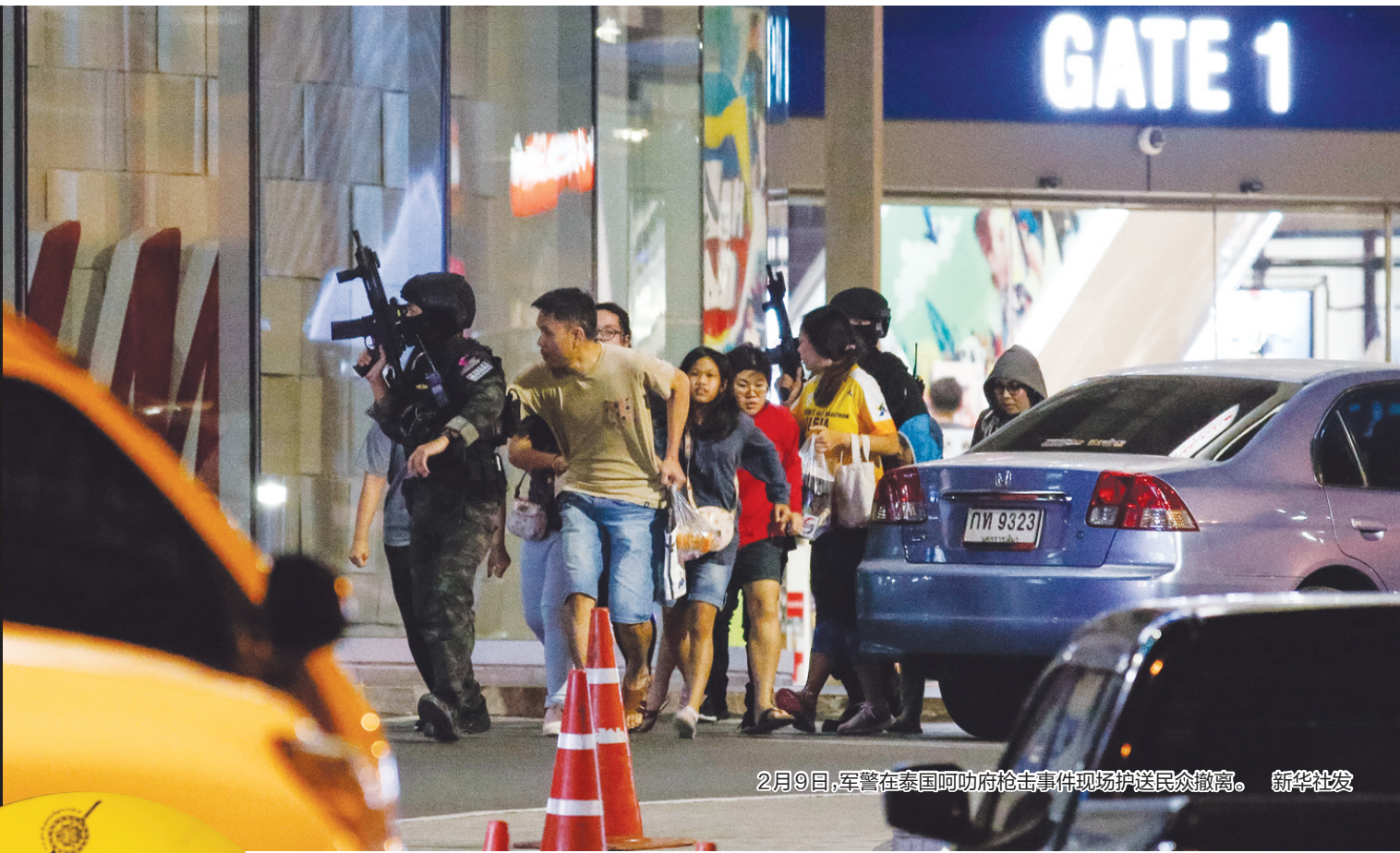
2月9日,军警在泰国呵叻府枪击事件现场护送民众撤离。