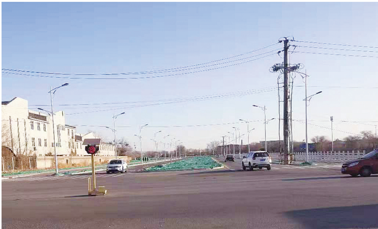
道路开通缓解了市区北部通往开平的交通压力