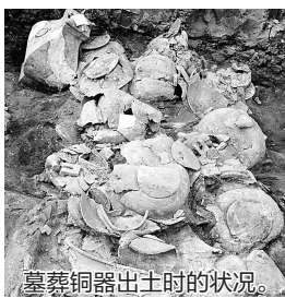
墓葬铜器出土时的状况。

2011年开始，秦始皇帝陵博物院对秦陵外城西侧的陵区展开详细的考古调查与勘探工作，取得了不少收获，随后对其中的一号墓葬（QLCM1）进行了发掘，取得了重要收获。