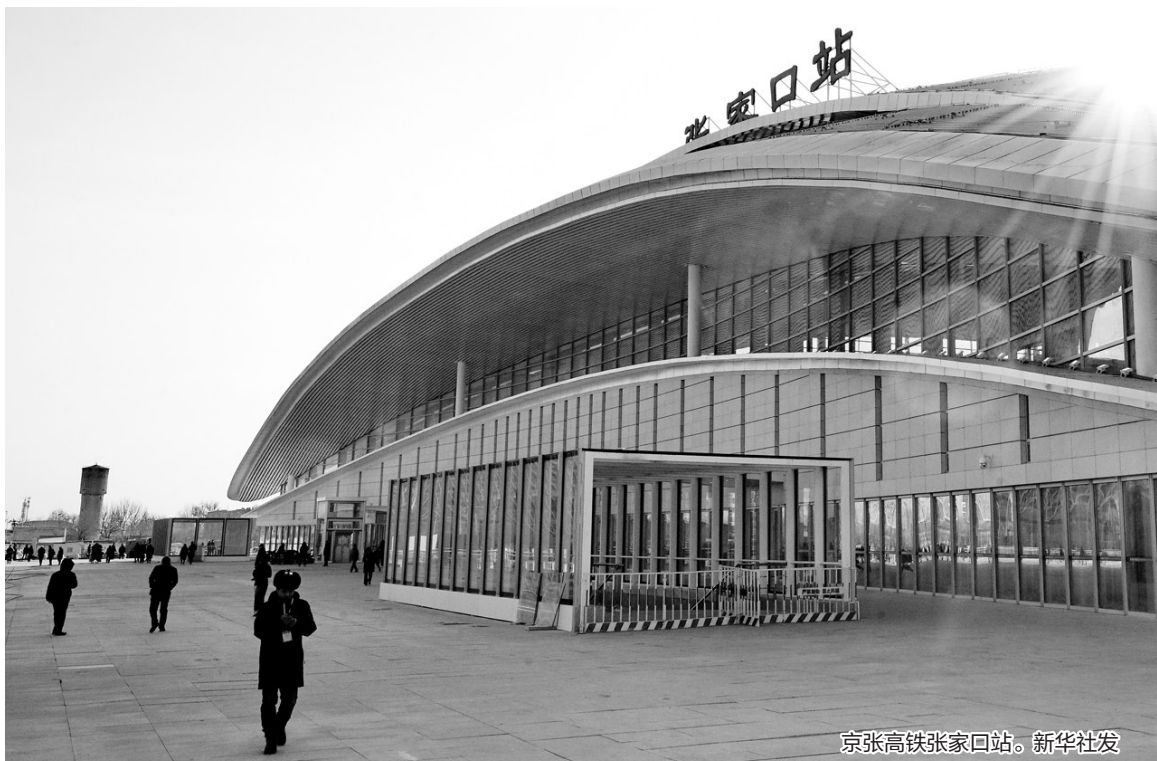
京张高铁张家口站。