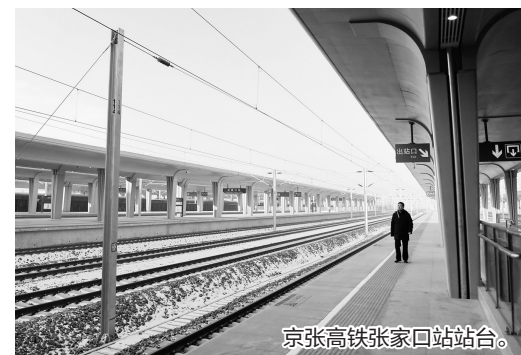
京张高铁张家口站站台。