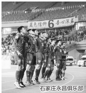
石家庄永昌俱乐部