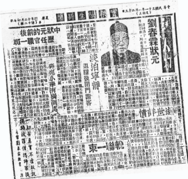
1942年《实报》辟专版报道刘春霖