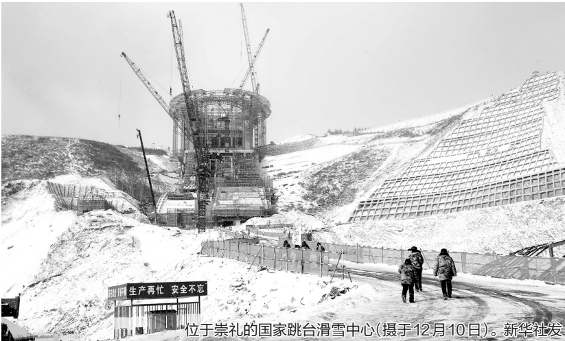
位于崇礼的国家跳台滑雪中心(摄于12月10日)。

石家庄市南绕城高速公路,主线全长52.89公里,路线起自石太高速并线互通,与石太高速公路相交并顺接平赞高速公路,向东沿衡井公路南侧布线,在窦王墓西北侧进入太行特长隧道(长约5公里),向东连接青银高速后在西良政与三环路南环相接,向东改建三环路南环14.2公里至段干与三环路南环分离,继续向东新建8.9公里,至终点与京港澳高速形成互通,并与在建的石衡高速公路顺接。