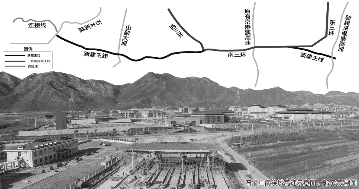
石家庄南绕城高速示意图。郭子亮/制图

日前,省发改委召开全省发展和改革工作会议,对明年工作进行部署。其中,在加强基础设施建设方面,提出要加快重点路网建设。推进雄安新区四纵两横高铁网、四纵三横高速网建设,建成京沈客专京承段、石家庄南绕城高速。在持续推进冬奥会筹办方面,提出确保76个冬奥项目明年8月底前全部如期到位。