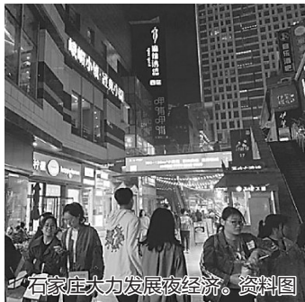
石家庄大力发展夜经济。资料图

同时,我省明年发展改革工作任务主要任务还包括抓投资促消费、推动产业转型升级、打造重点板块优势、深化改革开放、全面落实企业投资项目承诺制等多方面内容。