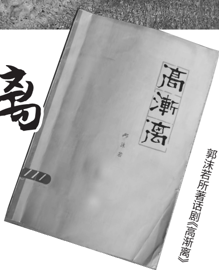
郭沫若所著话剧《高渐离》