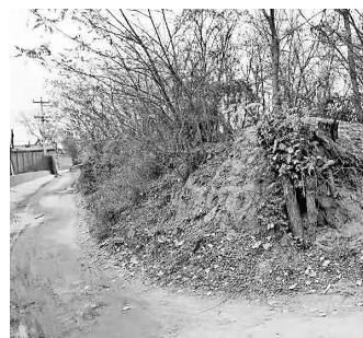
定兴县东高里村高家坡