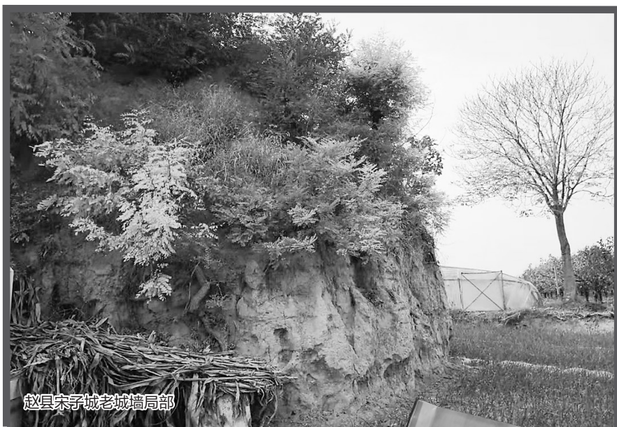
赵县宋子城老城墙局部