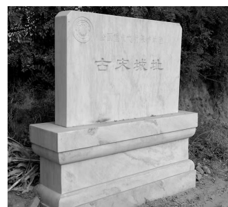
全国重点文物保护单位 古宋城址标牌