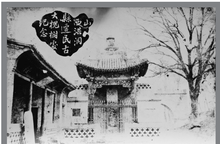
石家庄元村蔡氏收藏的民国初年祭拜祖先拍摄的洪洞县大槐树照片

康熙二十七年（1688年）废除卫所军屯“以真定、神武二指挥归并州县，军籍改为民籍，卫粮归人民粮”。从此，卫所军屯军丁改为自耕农，落籍真定府及周边州县，一大批军屯、兵营、关城驻军和军余，成为州县农民，使真定府州县在籍的人口大增，耕地面积扩大。