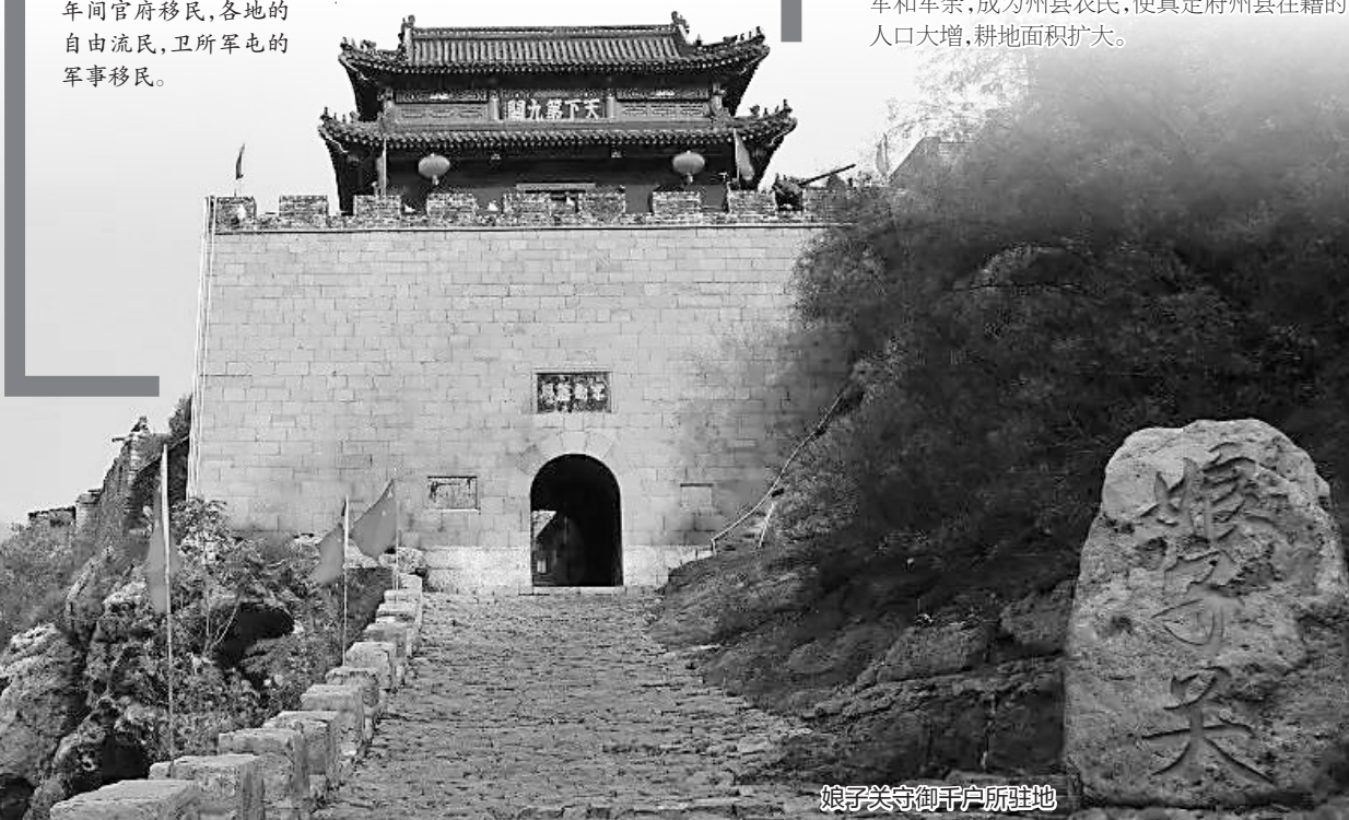
娘子关守御千户所驻地

嘉靖《南宮县志》记载：全县之民分为24社，其中土民14社，顺民2社，迁民4社，新徙民4社。其中顺民、新徙民即“永乐以来四方之民流寓于此占籍者”。