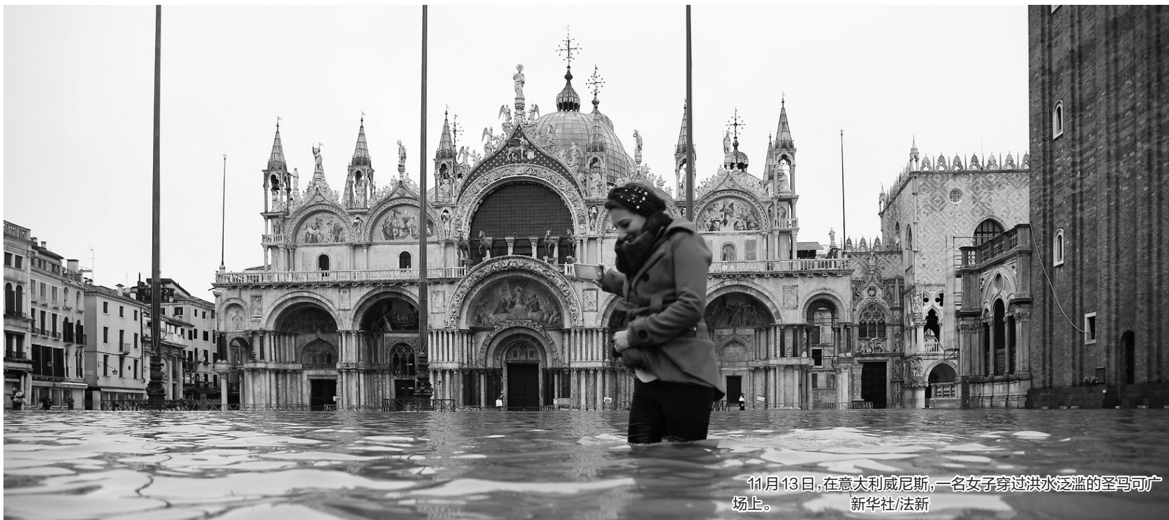
11月13日,在意大利威尼斯,一名女子穿过洪水泛滥的圣马可广场上。