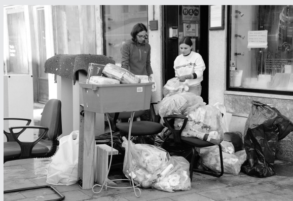
11月14日,在威尼斯,人们清理被洪水浸泡过的物品。