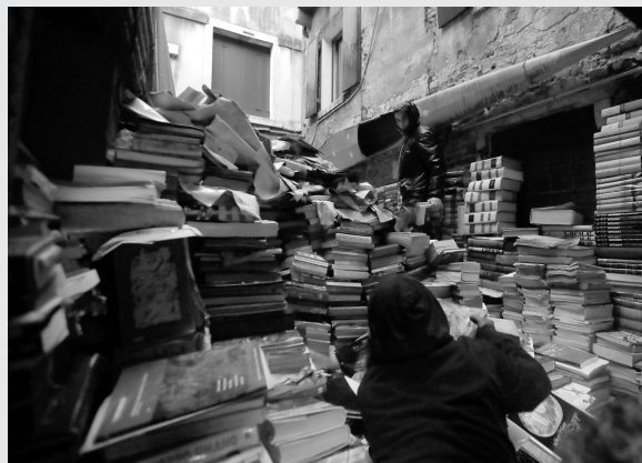
11月15日,在威尼斯,志愿者转移被洪水浸泡过的书籍。